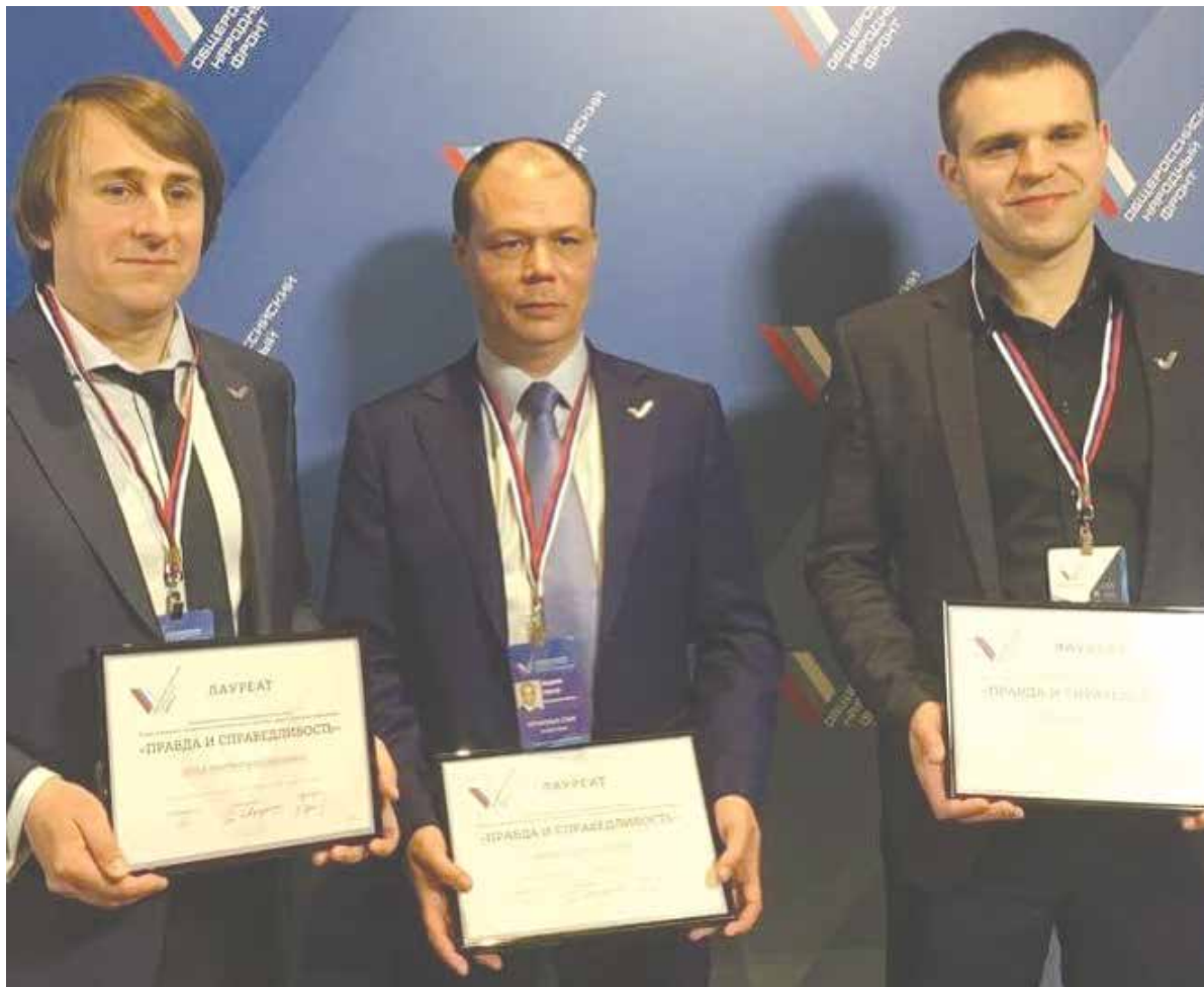
Члены подмосковного отделения «ОПОРЫ РОССИИ» не только приняли участие в Медиафоруме ОНФ в Санкт-Петербурге, но и получили заслуженные награды за активную общественную деятельность. Поздравляем!