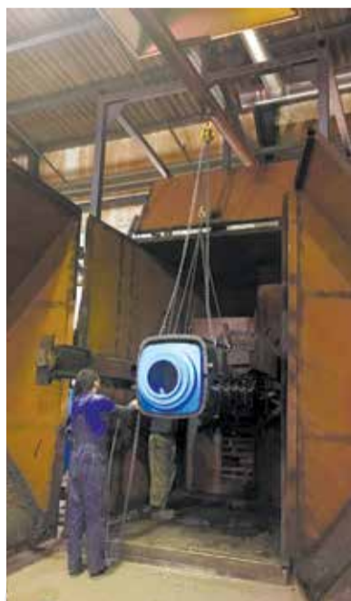
Изделия производятся методом ротационного формования и литьем под давлением

Наш корреспондент побывал на производстве и своими глазами увидел, как из безликого пластика рождается готовое изделие, которое совсем скоро найдет своего покупателя.