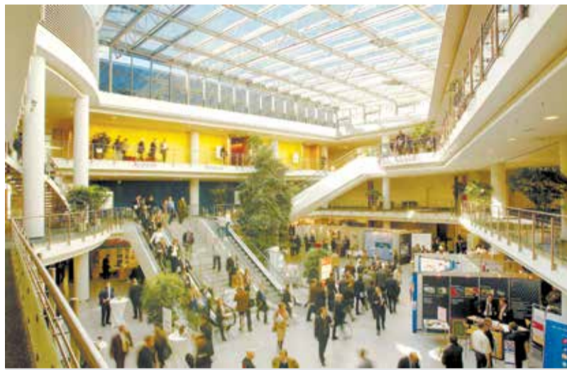
Нюрнберг Мессе — крупнейшая выставочная площадка не только в Германии, но и в Европе!

Мы тесно сотрудничаем с профильными организациями, сообществами, ассоциациями и союзами, и с «ОПОРОЙ