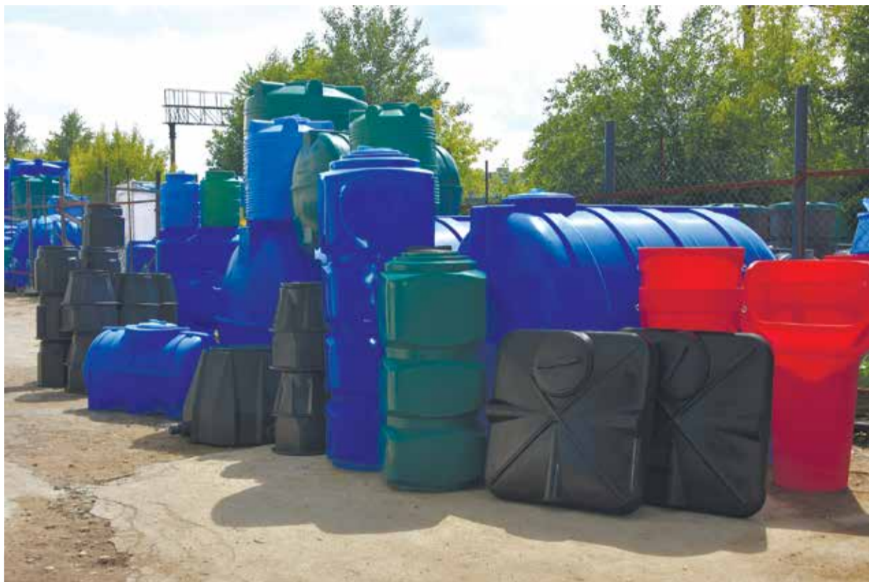
Компания «Полимер-Групп» предлагает широчайший ассортимент изделий из пластика!

Вообще, один из трендов, которому следуют в компании, — акцент на удобные готовые решения. Здесь понимают: людям нужен комфорт и сервис. Именно поэтому так важно предлагать готовые модульные решения, где все продумано за клиента. Останется только привезти и подключить!