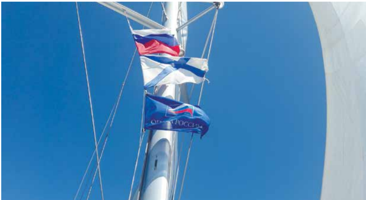
Развиваются флаги: парусная регата «ОПОРЫ РОССИИ» в Греции